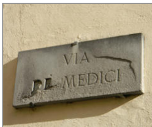
ANELLO DEI MEDICI