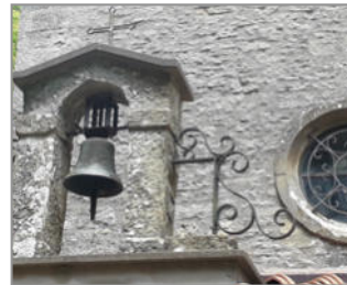
IL CAMMINO DI SAN FRANCESCO