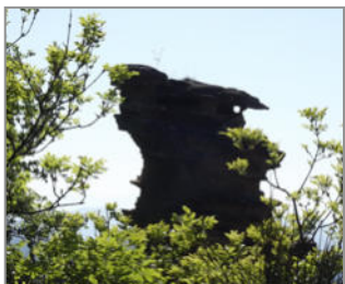
VIA DEGLI DEI

Pensiamo a tutto noi... devi solo camminare e scoprire il nostro Appennino!