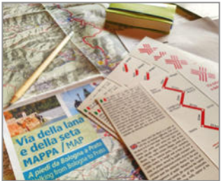
VIA DELLA LANA E DELLA SETA